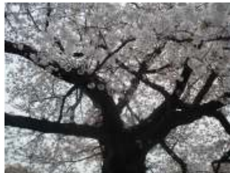
↑ 代々木公園の實在のものをモデルにした、1話の岩舟の桜の木